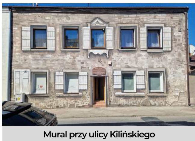
Mural przy ulicy Kilińskiego

O Szydłowcu pisały i mówiły liczne media i organizacje turystyczne, m.in. Poland Travel, Moda na Mazowsze, Mazowsze – Serce Polski, Mazowiecka Regionalna Organizacja Turystyczna, Lokalna Organizacja Turystyczna Ziemi Radomskiej, ParkMag, Sztuka Krajobrazu i PropertyDesign. Nasze miasto pojawiło się także w licznych materiałach vlogerów i podróżników, którzy z entuzjazmem polecali Szydłowiec swoim obserwatorom. Informacje o Szydłowcu publikowane były w materiałach informacyjnych m.in. PL LOT oraz PKP Intercity.