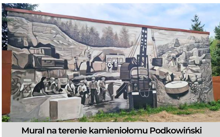
Mural na terenie kamieniołomu Podkowiński

Nie mogliśmy również ominąć aspektu wyjazdowego i promocji Szydłowca na eventach turystycznych na terenie kraju. Byliśmy obecni w Parku Śląskim w Chorzowie podczas targów “Atrakcje regionów” na stoisku Mazowsza, podczas Łódź Summer Festival 2025 oraz na Międzynarodowych Targach Turystycznych ITTF Warsaw w Pałacu Kultury i Nauki. Promowaliśmy m.in. Zamek Szydłowieckich i Radziwiłłów – siedzibę Muzeum Miasta Szydłowca, Kościół pw. św. Zygmunta, zalew szydłowiecki, Kamieniołom Podkowiński z tyrolką i via ferratą, które stały się magnesem dla miłośników aktywnego wypoczynku, a także Ratusz z Pracownią Władysława Aleksandra Maleckiego i tarasem widokowym, cmentarz żydowski oraz Muzeum Ludowych Instrumentów Muzycznych. Nie zabrakło też promocji murali, które zdobią nasze miasto i podkreślają jego artystyczny charakter. W ubiegłym roku powstały dwa kolejne, jeden przy ulicy Kilińskiego przedstawiający starą kamienicę oraz drugi przy Kamieniołomie Podkowiński, który ukazuje dawny kamieniołom.